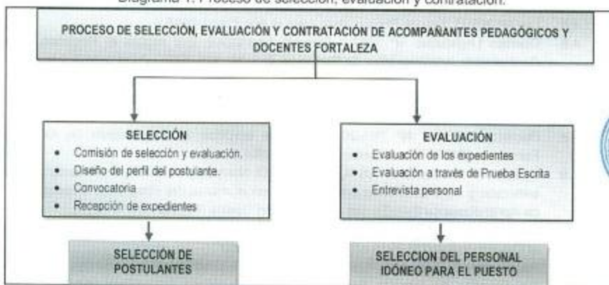
Diagrama 1: Proceso de selección, evaluación y contratación: