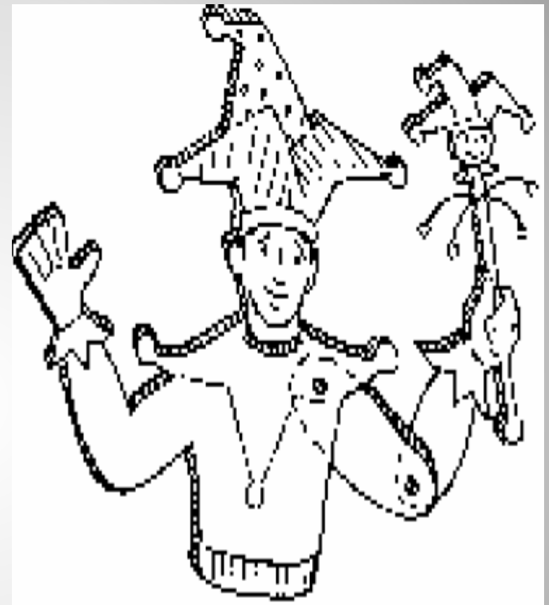
Los títeres de vara